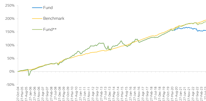
Kinerja Reksa Dana Sejak Diluncurkan

*OB: Obligasi, PU: Pasar Uang, SH: Saham